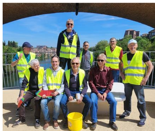
Les Signaleurs VTT et Route

Notre groupe 4 n'a pas rencontré beaucoup d'autres cyclos sur la rando moyenne de 87 kms (on est partis à 8h) mais le Président du CRA m'a confirmé tout sourire l'augmentation très sensible du nombre global de participants à la journée. Surtout le fait des autres clubs tarnais, semble-t-il. D'où un sacré florilège de maillots colorés. Lo Capial Saint Juérien, l'Association Sportive du Conseil Départemental, le dynamique club de Veilhes, le Dadou Graulhetois, Réalmont, Coufouleux, Castres et d'autres.